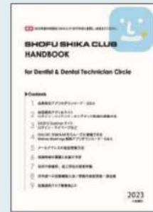
「SHIKA CLUB HANDBOOK」