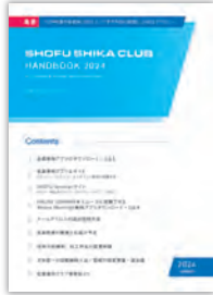
SHIKA CLUB HANDBOOK

次の画面でログインIDとパスワードの入力が必要です。 「SHIKA CLUB HANDBOOK」「Seminarサイトの使い方」をご覧ください。