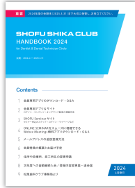
SHIKA CLUB HANDBOOK

次の画面でログインIDとパスワードの入力が必要です。 「SHIKA CLUB HANDBOOK」「Seminarサイトの使い方」をご覧ください。