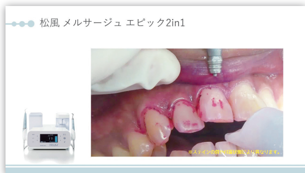
※スライドイメージ