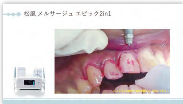
※スライドイメージ