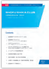
SHIKA CLUB HANDBOOK

次の画面でログインIDとパスワードの入力が必要です。 「SHIKA CLUB HANDBOOK」「Seminarサイトの使い方」をご覧ください。