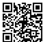
松風ホワイトニングシステム