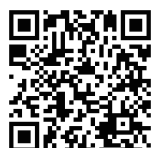
TRIOS 4 オーラルスキャナ システム