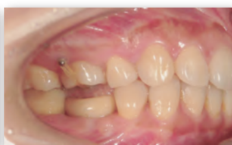
アンカースクリューを使用した上顎第一大臼歯の圧下症例