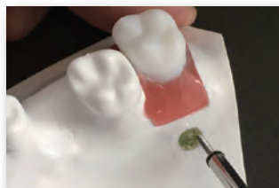
アンカースクリュー埋入実習