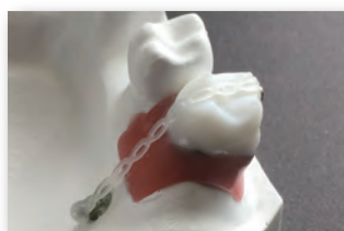
歯牙模型実習：シザーズバイト改善