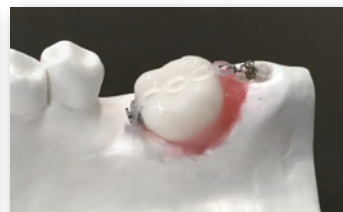
歯牙模型実習：アップライト