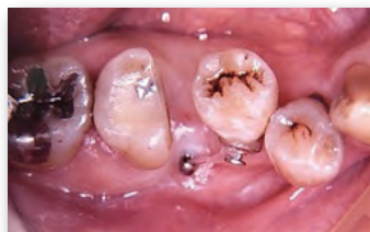
アンカースクリューを使用した下顎小白歯アップライト症例

動かせる歯牙模型を使用した埋入実習 アンカースクリューを使用し、アップライト・圧下・シザーズバイトの改善等の歯牙移動テクニックを実践します