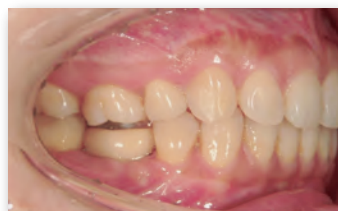
アンカースクリューを使用した上顎第一大臼歯の圧下症例