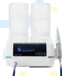
メルサージュ エピック S