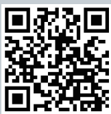
お申込み専用QRコード