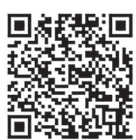
お申し込み専用二次元バーコード