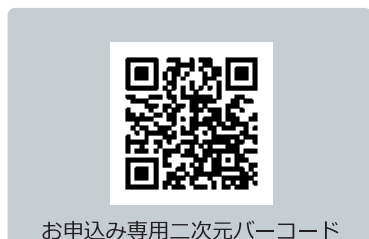
お申込み専用二次元バーコード